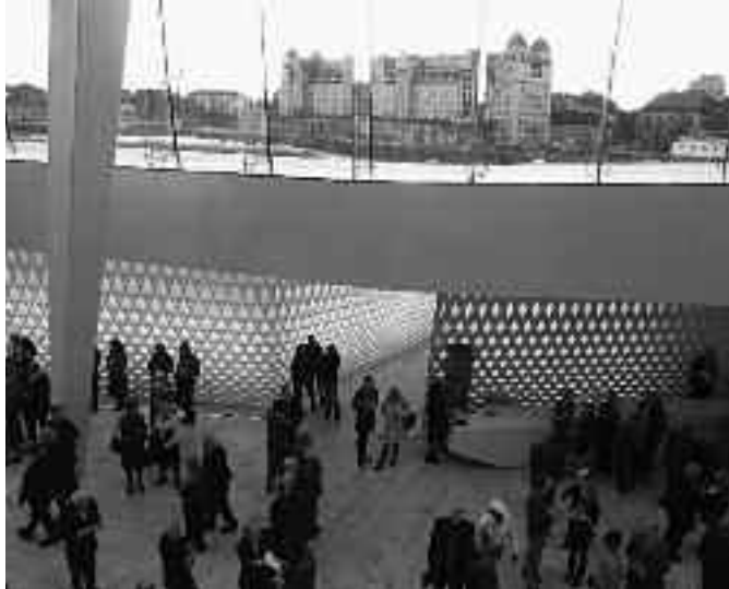
Im Operhuset, Oslo; Foto: Michael Gnekow

Der Osloer Tannhäuser war derart spektakulär, dass zwei Tage später die «Ariadne von Naxos» im gleichen Haus keine Chance hatte, sich auch ins Gedächtnis einzuprägen. Dies im Gegensatz zur konzertanten Aufführung von «Romeo und Julia im Jahr 2010»