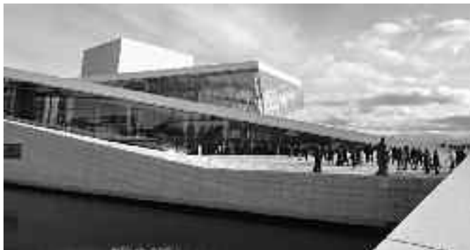
Operhuset, Oslo; Foto: Michael Gnekow

Nach der Besichtigung enterte die Reisegruppe einen kleinen Segler und unternahm, bei abwechselnd Bise, Regen, Schnee und Sonne einen einstündigen Törn durch den Fjord. Die einen auf, die andern unter Deck, erfrischend für Kopf und Haut war es auf alle Fälle.