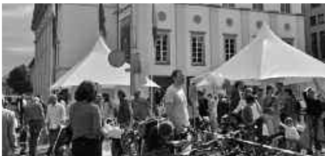
Impressionen vom Betriebsausflug 2010 und vom Theaterfest 2009.