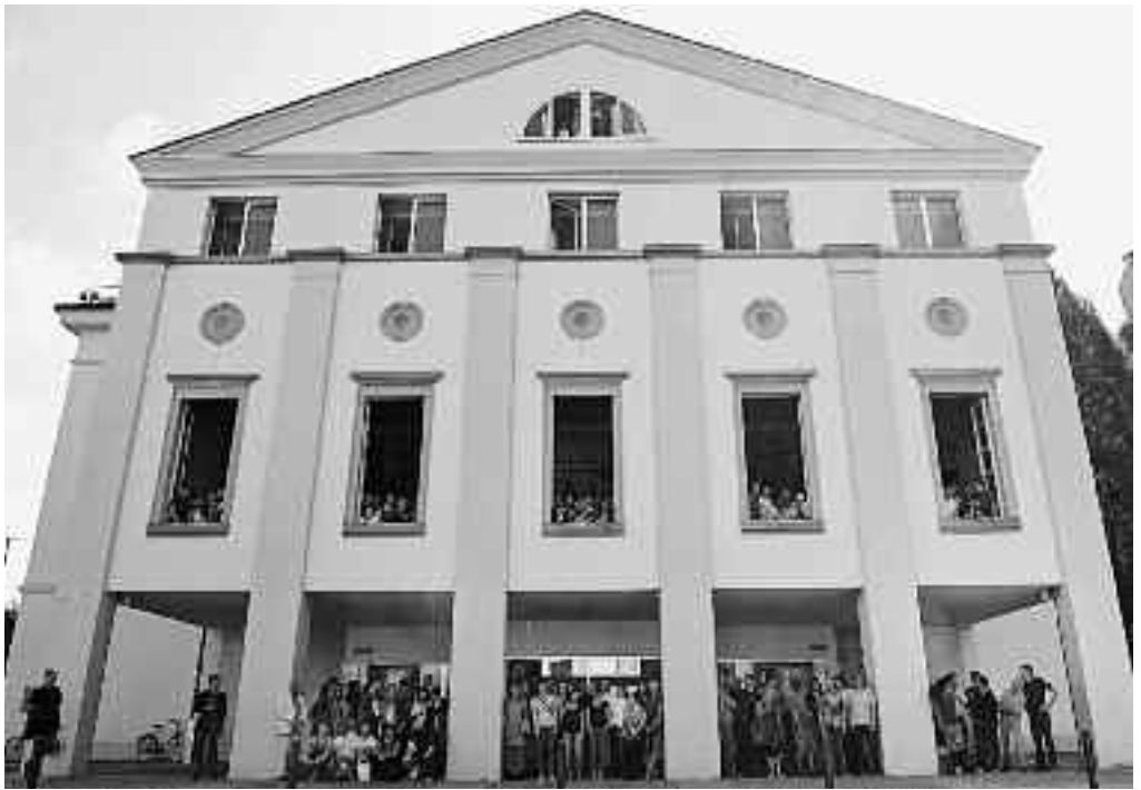
Mitglieder des Luzerner Theaters vor dem Saisonbeginn 2010/2011.